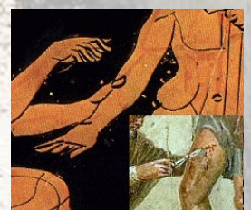
Operazioni mediche in antico