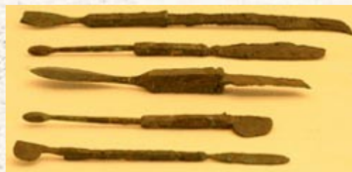
Strumenti medici (Pompei, Domus del Chirurgo) Sullo sfondo: la Domus pompeiana del Chirurgo.