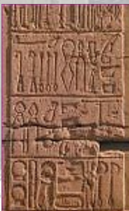
Strumenti medici (Kom Ombo)