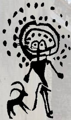
Sciamano preistorico (incisione rupestre dal Kazakistan)

M. BERNABÒ BREA, S. SANTORO: Dalla natura alla tecnica, il fil rouge del sapere artigianale